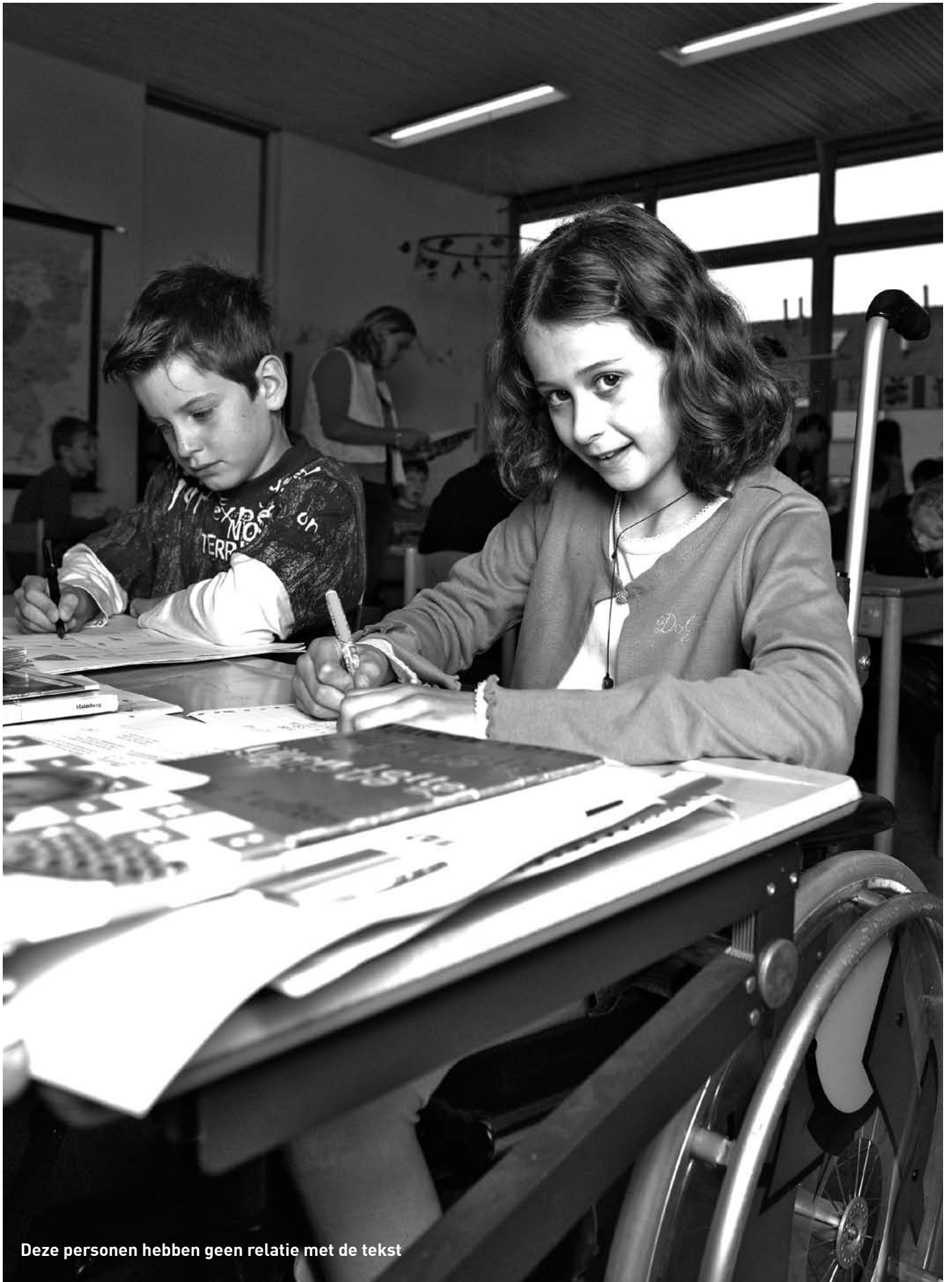
Deze personen hebben geen relatie met de tekst